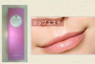
プラセンタ配合リップ

右側のみ リップエス テと近赤外線をしていま す。ほほの周りがすっき りし口角が上がっている のがわかります。